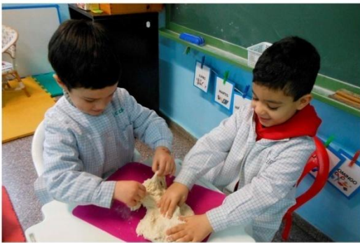
9. Amasamos y dejamos reposar