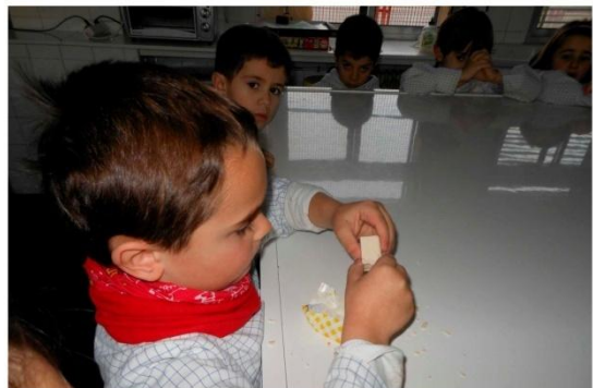
4. Echamos la levadura