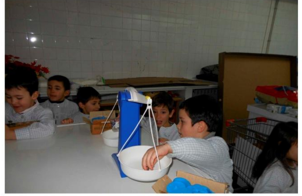
6. Pesamos la harina