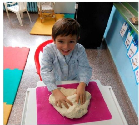
10. Amasamos y damos forma