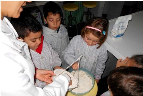
7. Mezclamos todo