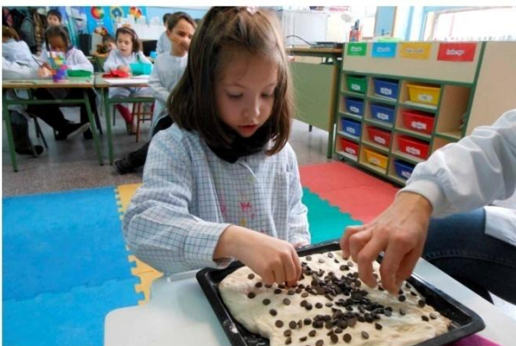
11. Echamos el chocolate