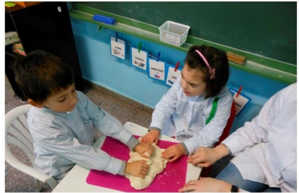
8. Amasamos y dejamos reposar