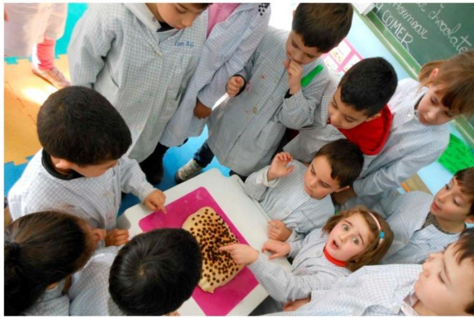
13. Sacamos del horno y...