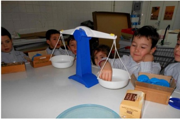
5. Pesamos el azúcar y la sal