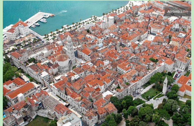
Núcleo histórico de Split