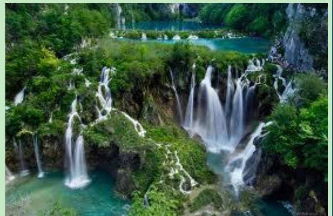
Parque nacional de Plitvice