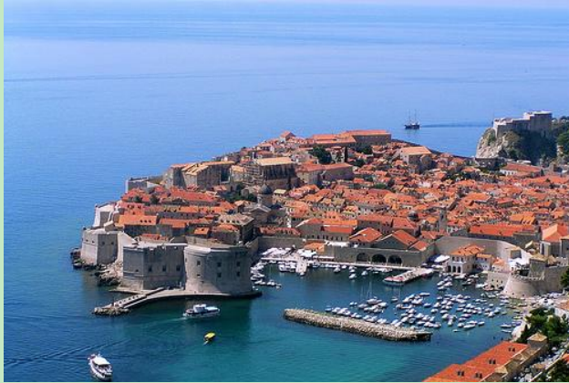
Casco antiguo de Dubrovnik